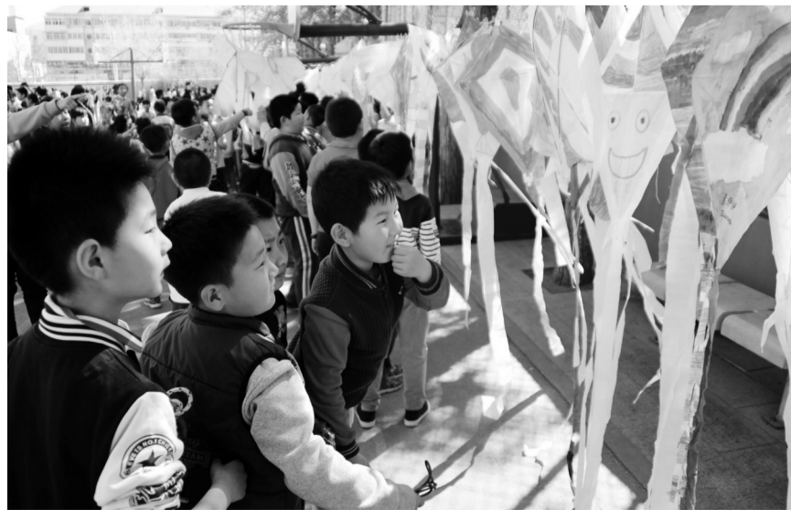
本报讯 育园小学近日举办了“童嬉纸鸢”风筝节,700余名学生参加活动。学校将每位学生放飞风筝的快乐情景定格成照片送给学生和家。

在实践活动中,学生充分发挥各自的创意思维,锻炼了动手能力,提高了综合研究能力。别样的风筝节为学生搭建了广阔的自主学习平台。