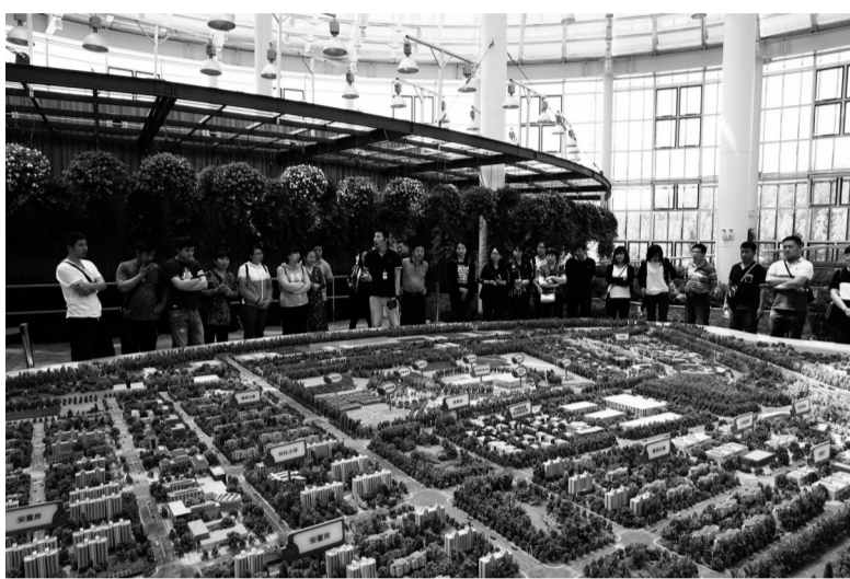
引投资、提升农业规模化经营管理水平,提升农业产值和附加值,以及在带动低收入村发展、低收入农户增收、促进农民就业,为建设宜居宜业宜游现代化生态新区做出更大的贡献。

界级都市农场,2015年10月开园,规划总面积约1178亩,固定资产投资3.8亿元,内设“一心六园”即智慧农业中心和花田漫步、牧场优歌、乡野记忆、田园拾萃、林间采蔬、伊甸寻芳六大室外主题园区。该农场直接解决当地农民就业100余人,全部上社会保险,提升了该区域人流量和知名度。2016年,该农场营业额门票收入约800万元,农产品销售收入约300万元。 区农业局举办这次活动是实施党建工作“六抓六强化工程”的一个具体举措。一方面是服务党建引领发展,开阔视野,零距离学习了解我国一流智慧农场发展思路、生产情况、经济社会效益;另一方面主要是营造氛围,调动机关党员、共青团员深入思考在全面建成小康社会新常态形势下,如何结合我区实际,吸