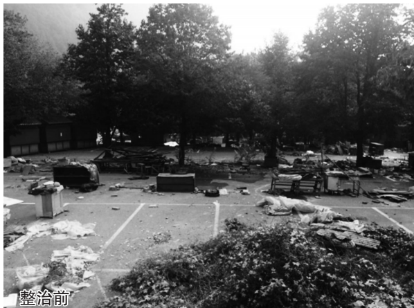
本报(通讯员 王良)潭柘寺景区小商品市场经综合整治后,建立了长效管理机制,未再发生摊贩私占停车场和景区内乱摆摊的行为,景区环境和秩序得到了有效改善和提升,确保了潭柘寺景区4A复核工作的顺利通过。